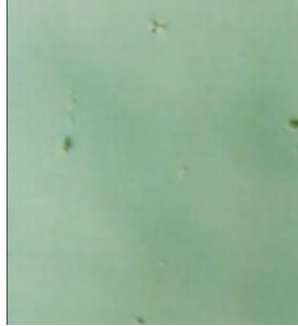
Επιφάνεια με Clean+